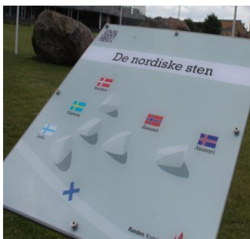
"De Nordiske Sten" i Tronholmparken